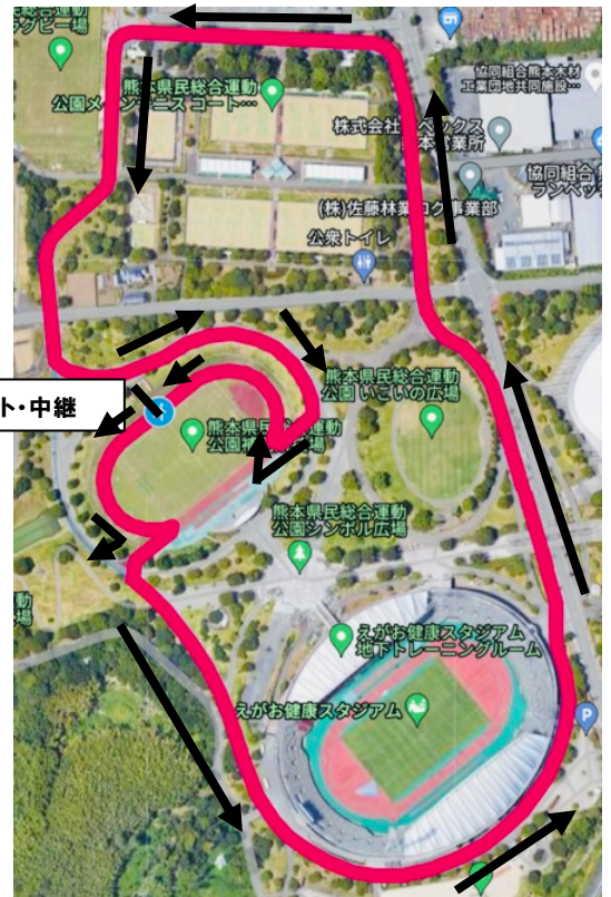
【女子周回コース図】